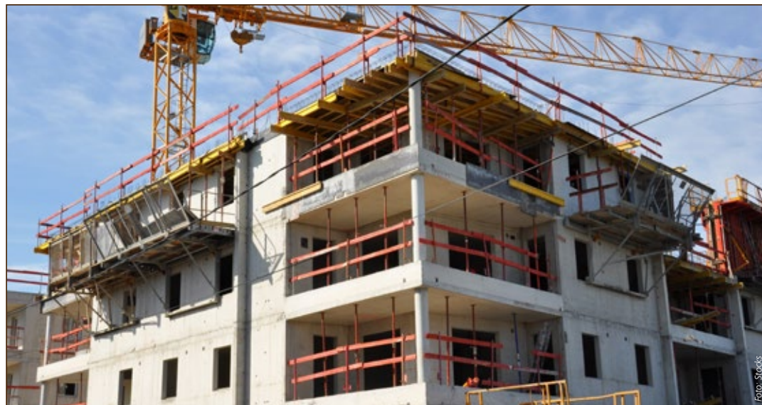
Stuttgart braucht dringend mehr Neubauprojekte

Der Immobilienbrief Stuttgart darf zu Informationszwecken kostenlos beliebig ausgedruckt, elektronisch verteilt und auf die eigene Homepage gestellt werden; bei Verwendung einzelner Artikel oder Auszüge auf der Homepage oder in Pressespiegeln ist stets die Quelle zu nennen. Der Verlag behält sich das Recht vor, in Einzelfällen diese generelle Erlaubnis zu versagen. Eine Verlinkung auf die Homepages des Immobilienverlag Stuttgart sowie ein auch nur auszugsweiser Nachdruck oder eine andere gewerbliche Verwendung des Immobilienbrief Stuttgart bedarf der schriftlichen Genehmigung des Verlags. Alle früheren Ausgaben des Immobilienbrief Stuttgart, die Metadaten sowie grundsätzliche Informationen befinden sich im Internet unter www.immobilienbrief-stuttgart.de . Gastbeiträge geben die Meinung des Autors und nicht unbedingt die der Redaktion wieder.