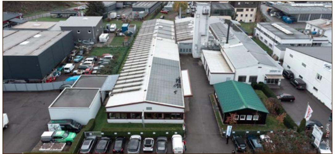
Produziert wird in einer ehemaligen Schreinerei in Tübingen

100 Millionen Euro möchte die Trias Verwaltungsgesellschaft in die Entwicklung des ehemaligen Stoll-Areals in Reutlingen investieren. Der Gemeinderat stimmte einstimmig den Plänen von Isin + Co. Generalplaner Architekten zu, die auf dem 2 Hektar großen Areal ein klimaneutrales Quartier mit 42 000 m 2 BGF für Büros und Bildungseinrichtungen, ein Hotel, Serviceapartments und Gastronomie vorsehen. 2018 hat Trias das Areal erworben, das Projekt hat den Status eines IBA-Vorzeigeprojekts. Nachhaltigkeitsmerkmale sind unter anderem PV-Anlagen, Eisspeicher, ein Wärmekältenetz und die Nutzung von Regen- und Grauwasser.