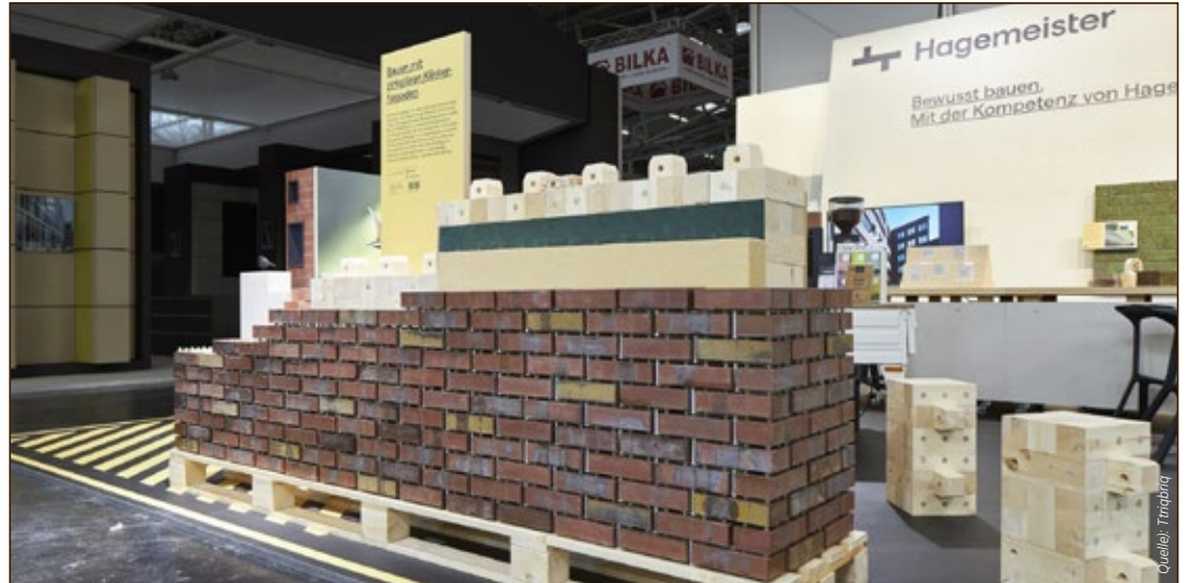
Die Kreislaufwand wurde auf der Bau 2023 ausgezeichnet

Das Statistische Amt der Landeshauptstadt gibt künftig einen Newsletter heraus, in dem die Beiträge der Monatshefte veröffentlicht werden. Anmeldung unter www.stuttgart.de/newsletter .