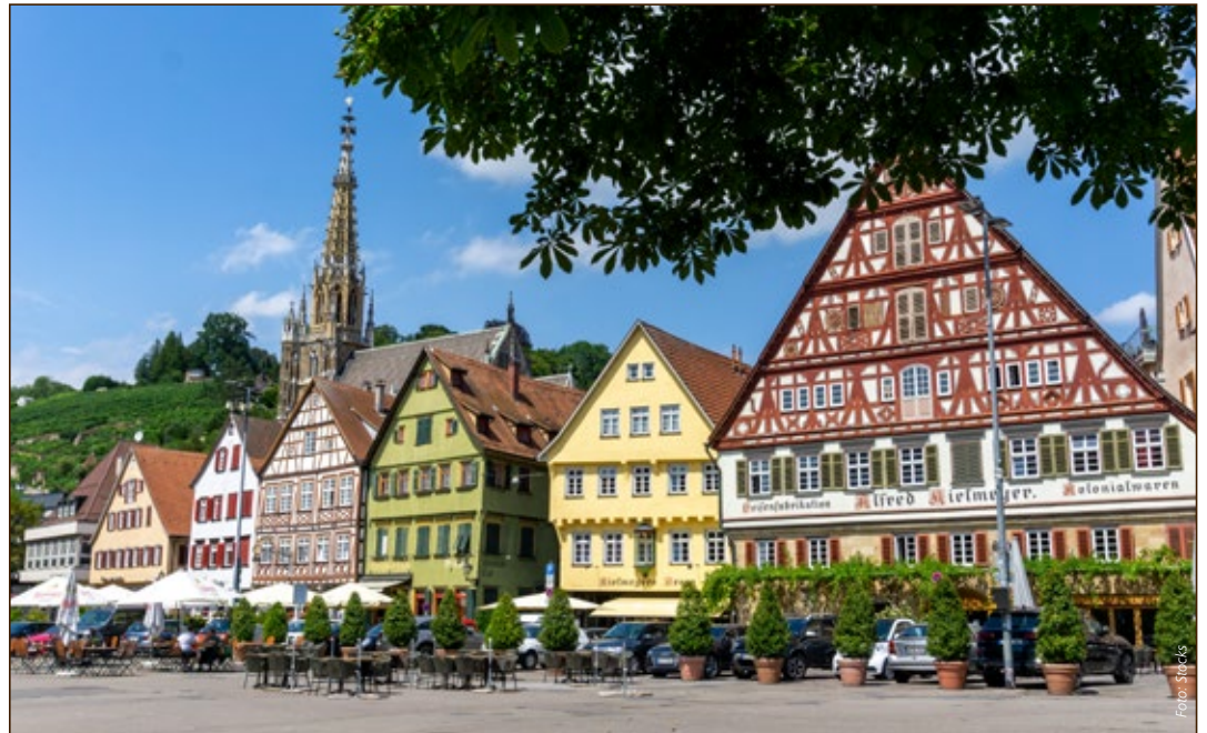
Am Esslinger Marktplatz wird kein neues Baurecht geschaffen, anderswo schon

Die Stadt Esslingen hat beschlossen, worüber in Stuttgart noch diskutiert wird: Eine Sozialquote von 50 Prozent bei einer Bindung von mindestens 30 Jahren. Haus & Grund sowie Vertreter der Immobilienbranche warnen vor den negativen Folgen.